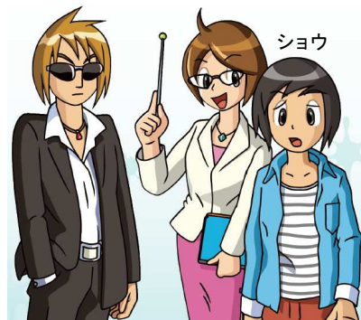
イラスト：大河原一樹